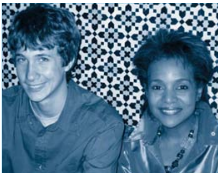
En 2006 Ryan a accompagné Son Excellence le Gouverneur Général Michaelle Jean lors d'un voyage d'État dans cinq pays d'Afrique pour démontrer comme les partenaires canadiens et africains travaillent ensemble pour obtenir résultats en Afrique.